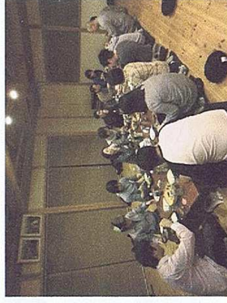
会費制懇親会の様子

このような会に、ご興味はあってもご自分からは積極的にお申し込みをされないう方も多いです。ご親戚やご友人、お知り合いなどで独身の方がいらっしやいましたら、ぜひ背中を押してさしあげてください。